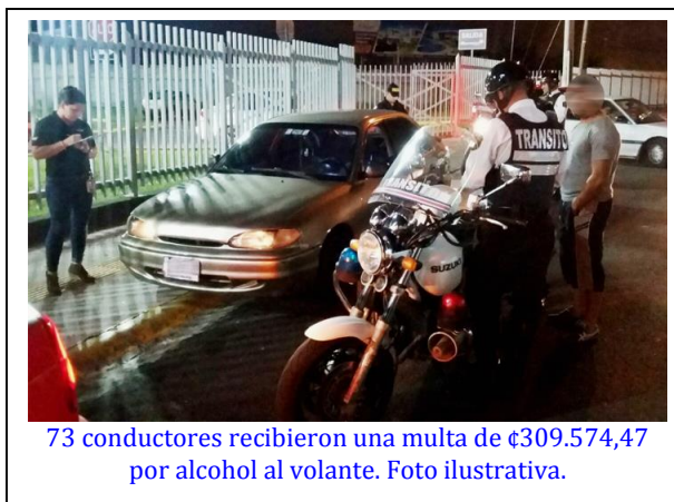
73 conductores recibieron una multa de €309.574,47 por alcohol al volante. Foto ilustrativa.

El resultado se obtiene de dividir los 499 casos detectados de alcohol penal según la prueba de aire espirado, divididos entre los días que conforman los primeros tres meses del año. A estos conductores se agregan otros 73 con una cantidad de alcohol en sangre que ameritó una sanción de €309.574,47 y acumularon 6 puntos en la licencia.