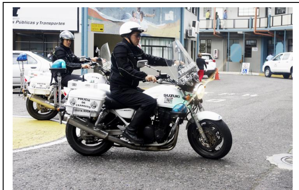
Las jackets son impermeables. Tienen cintas y la palabra Tránsito en material reflectante de la luz.

Estos abrigos con bolsa de aire, que se adquieren por primera vez, forman parte de una compra por ¢153.388.195 que realizó el Consejo con su presupuesto 2013 para equipamiento del cuerpo policial.