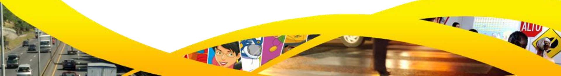
Participantes I edición de Héroes en COSEVI.